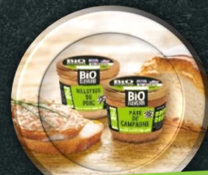
La gamme conserves