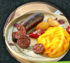
La gamme charcuterie