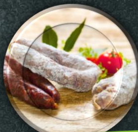
La gamme SEC