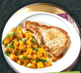
La gamme boucherie