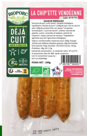
Chip'ette goût merguez x4