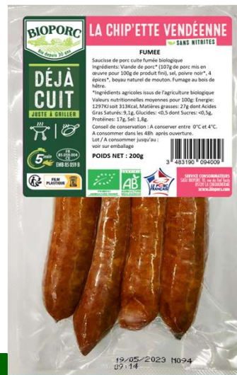
Chip'ette fumée x4