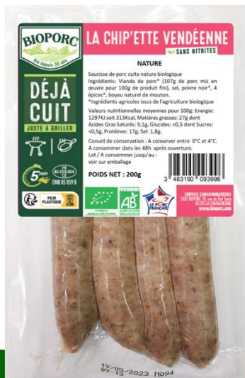
Chip'ette nature x4