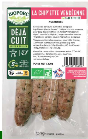
Chip'ette aux herbes x4